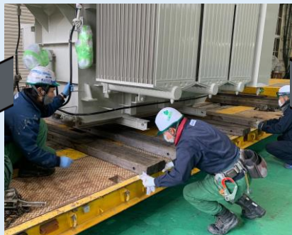
機械器具設置据付