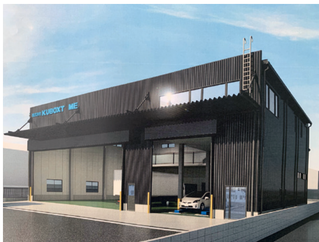
(完成予想図) 2022年3月竣工予定

当社のグループ会社である「KUBOXT ME」は、総工費2億円を投じて社屋の全面建て替えに着手。敷地1300㎡に、2階建700㎡の社屋を新築し、5台分の整備スペースに天井クレーンを備えます。既存業務に加え、他社への営業を強化し、売上高1億5000万円を目指します。また、最新鋭の機械やエアコン付きの作業場など、働きやすい職場環境を追求し、労働安全衛生の強化や人材育成をすすめます。